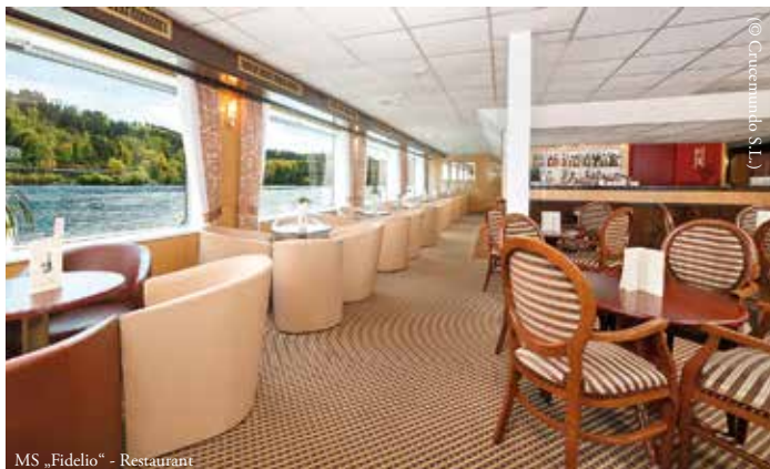
MS „Fidelio“ - Restaurant