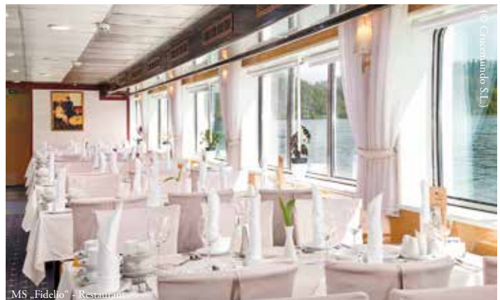
MS „Fidelio“ - Restaurant