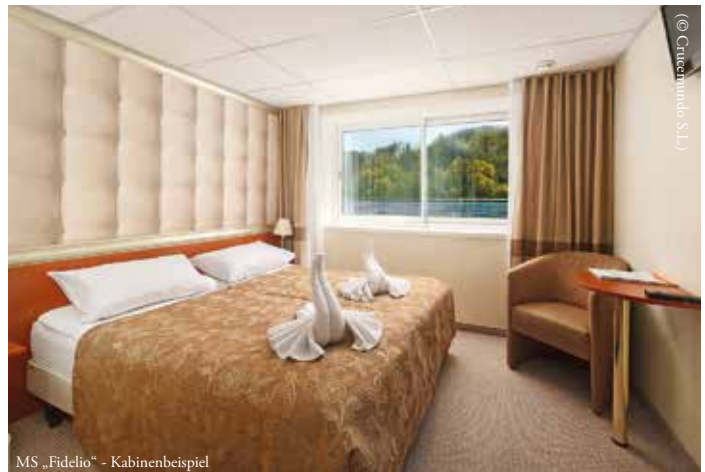
MS „Fidelio“ - Kabinenbeispiel