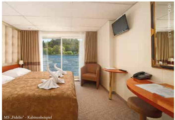
MS „Fidelio“ - Kabinenbeispiel

Auf dem Mitteldeck befindet sich das Panorama-Restaurant, in dem Sie bei einer ausgezeichneten Sicht Köstlichkeiten und Getränke genießen können. Außerdem lädt Sie der kleine Bordshop bei der Rezeption zum Schlendern ein. Auf dem Oberdeck können Sie in der Panorama-Lounge die gute Aussicht genießen und in der Bar/Lounge den Tag gemütlich ausklingen lassen. Einen kleinen SPA-Bereich mit Sauna und Fitnessraum finden Sie auf dem Hauptdeck und auf dem Sonnendeck können Sie es sich bei gutem Wetter gemütlich machen. Dort stehen Ihnen eine Bar, Liegestühle und ein Pool zur Verfügung.