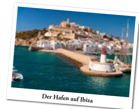
Der Hafen auf Ibiza

Ibiza — Die malerische Insel der Balearen ist weltweit bekannt für seine weißen Sandstrände und Buchten mit kristallklarem Wasser, aber auch als die Wiege der elektronischen Musik weltweit anerkannt. Das Landesinnere könnt ihr im Rahmen von Ausflügen kennen und lieben lernen. Ibiza Stadt lädt zum Bummeln ein.