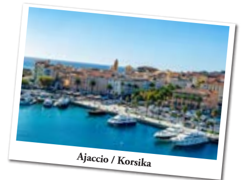
Ajaccio / Korsika

Ajaccio / Korsika — Ajaccio, die Hauptstadt der französischen Mittelmeerinsel Korsika ist eine malerische Hafenstadt an der Westküste der zerklüfteten Insel. Hier wurde 1769 der französische Eroberer Napoleon Bonaparte geboren. Der ehemalige Stammsitz der Familie, das Maison Bonaparte, stellt heute als Museum Familienerbstücke aus. In der barocken Kathedrale von Ajaccio aus dem 16. Jahrhundert wurde Napoleon getauft. Hier sind Gemälde von Delacroix und Tintoretto zu bewundern.