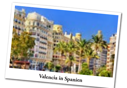
Valencia in Spanien

Valencia — Valencia, die drittgrößte Stadt Spaniens, begeistert mit einer faszinierenden Mischung aus Gotik, Barock, Jugendstil und futuristischer Architektur, darunter Werke von Santiago Calatrava, einem berühmten Sohn der Stadt. Den Tag solltet ihr in der Altstadt mit der Barrio del Carmen beginnen, gefolgt von der Kathedrale und der Markthalle. Der Besuch der Seidenbörse ist sicherlich auch sehr interessant. Das drittgrößte Aquarium der Welt mit mehr als 550 Meerestieren liegt ca 3 km südlich der Stadt.