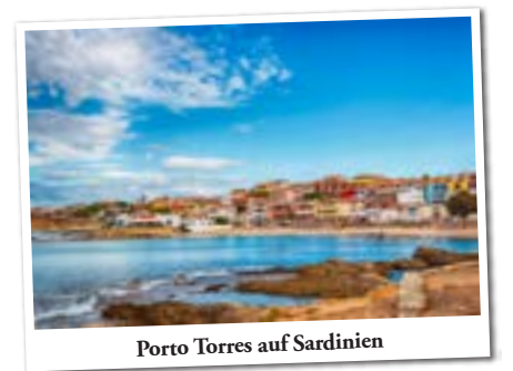
Porto Torres auf Sardinien

Porto Torres / Sardinien — Die italienische Hafenstadt im Norden der Insel Sardinien bietet den Gästen Sehenswürdigkeiten aus der prähistorischen Zeit, der Antike sowie dem Mittelalter und aufgrund seiner Lage an der Küste auch die Möglichkeit für erholsame Stunden am Strand (östl. der Stadt) oder einen Ausflug zum nahegelegenen Nationalpark.